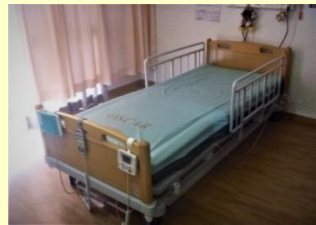
体位変換付き 高性能エアマットレス