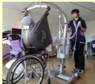
床走行式電動介護リフト