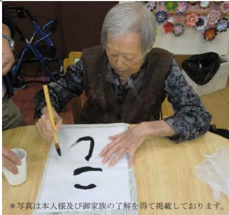
*写真は本人様及び御家族の了解を得て掲載しております。